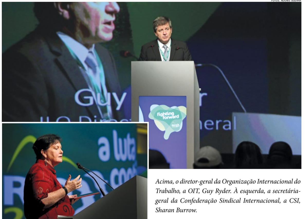
Acima, o diretor-geral da Organização Internacional do Trabalho, a OIT, Guy Ryder. À esquerda, a secretária-geral da Confederação Sindical Internacional, a CSI, Sharan Burrow.

também denunciou o golpe. “O modelo global econômico está esfacelado”, sentenciou.